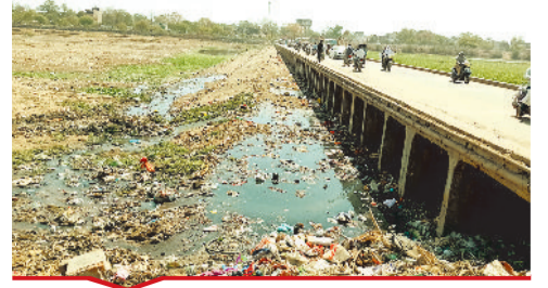
सफाई नहीं होने पर अरपा में गंदगी।

[ बिहटा | मस्तूरी | तखतपुर | मुंगेली | कोटा | लोरनी | सरगांव | पेंड़ा | बेलतरा | रतनपुर | पथरिया ]