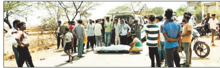
सड़क पर शव रखकर प्रदर्शन करते ग्रामीण।