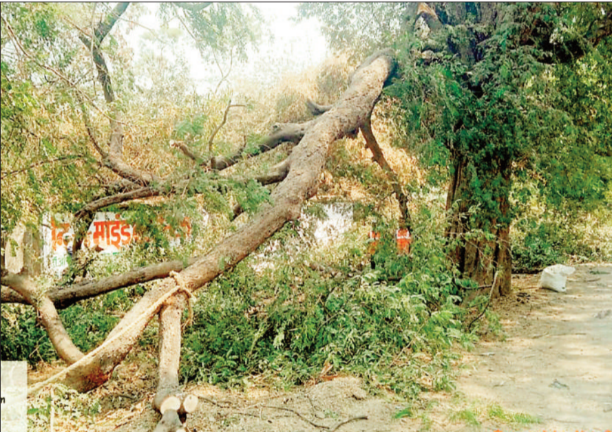
दर्रिघाट से लालखदान के बीच काटे जा रहे पेड़।