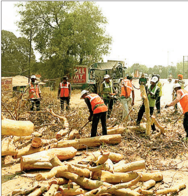
पेड़ों की कटाई के बाद एकत्रित लकड़ी।