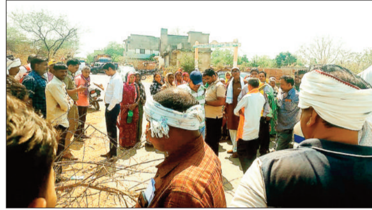
घटनास्थल में लगी भीड़।

आरोपी को अपनी पत्नी पर गांव के शोख सलीम से अवैध संबंध होने का संदेह था। उसने अपनी पत्नी को तलाक दे दिया है। उसी रंजित में शोख सलीम व चांद खान को मारने के लिए गए। नहीं मिलने पर उसकी मां की हत्या कर दी गई और परिवार के लोगों पर जानलेवा हमला किया गया है। आरोपियों को गिरफ्तार कर लिया गया है। -रजनेश सिंह एसएसपी