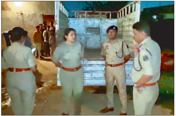
रतनपुर के पेंडरवा पहुंचे एसएसपी, छावनी में बदला गांव।